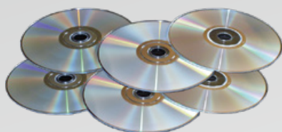
CDs und Datenträger (Festplatten)